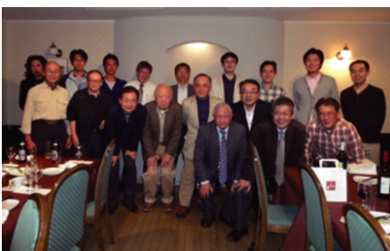
コース終了後の懇親会風景

今まで上流工程のプロジェクトに携わる際は、判断基準や行動基準が自分の中で明確になっておらず、「これでいいのか?」と自問を繰り返すことが多かったと思います。今回のケース研修では、ITによる改革のきっかけ作りからIT導入後の振り返りまでの各工程で必要となる知識を、体系的かつ実践的に習得することができました。この結果、上流工程で必要となる活動の指針が自分の中で確立でき、今までよりも余裕をもった対応ができるようになったと実感しています。