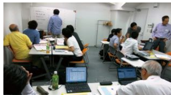
グループ討議風景