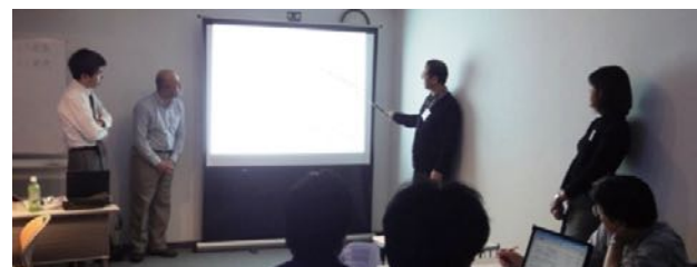
コース最終日のプレゼンテーション風景

ウラ面⇒「お申込み方法」、「具体的なケース研修の流れ」、「ITコーディネータとは」、「ITコーディネータ資格取得のメリット」、「ケース研修受講者の声」、「ITMSについて」